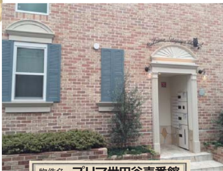
物件名 プリマ世田谷壱番館