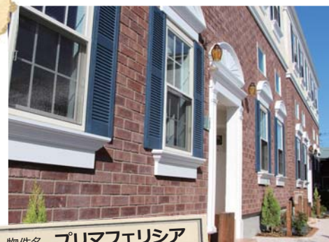
物件名 プリマフェリシア