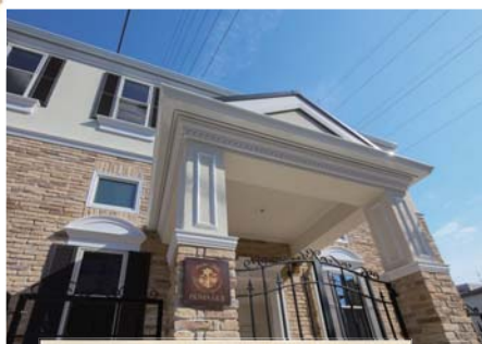
物件名 PRIMA LILIE