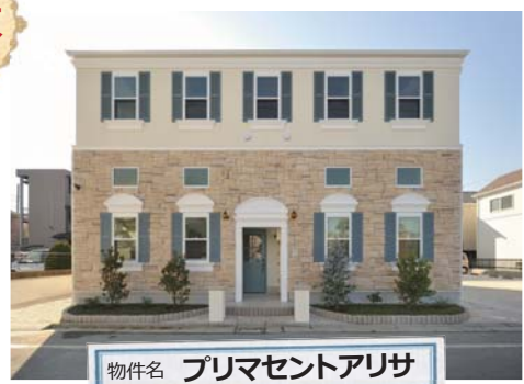
物件名 プリマセントアリサ