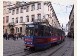
リヴィウの街並み