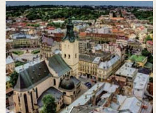
ルネサンス様式、バロック様式などの建築物が建ち並ぶ歴史ある街

今では「ヨーロッパの真珠」と呼ばれ、長い歴史の中で培った美しい街並みを保ち続けています。