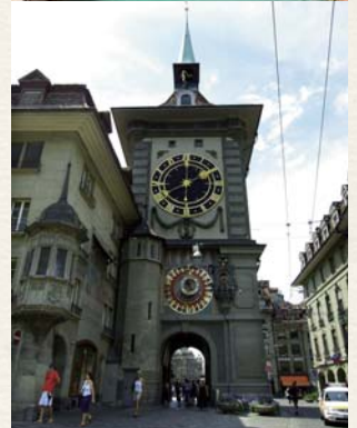
さまざまな装飾人形が時を告げる時計塔