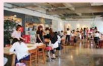
プリマビューティーイベント

スタイルアップにつながる『衣・食・住+美』に関する様々なイベントやセミナーを企画開催し、より素敵な毎日を過ごすお手伝いをしています。また、コミュニティーを通じ、プリマへの憧れや魅力を感じていただき、たくさんの”プリマファン”を繋げていくことで、入居者はもちろんのことオーナー様にとっても素敵な毎日のベースになることを願っています。