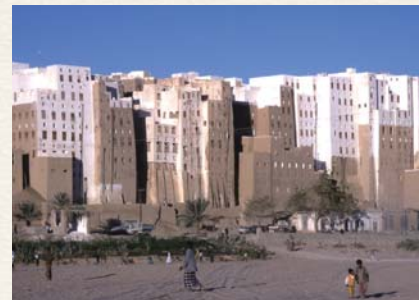
砂漠のマンハッタンと呼ばれるシバームの高層ビル群