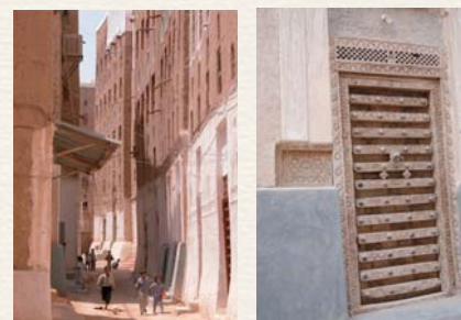
5階～9階建ての高層建物 代表的なアカシアの木製建具