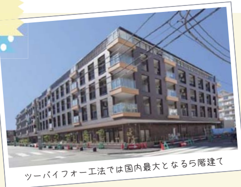
ツーバイフォー工法では国内最大となる5階建て