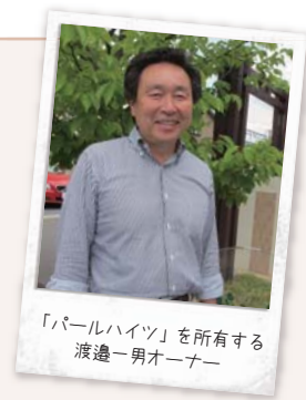
記事:株式会社プリマ倶楽部 永田

日課は、敷地内の見回り、掃除や草取り。入居者さんから何気ない会話から困っていることを聞き出して、すぐに対応しているそうです。自転車の空気入れや脚立、工具用品などを揃え、入居者さんは自由に使えるようになっております。「今まで返却されなかった事は一度もない」との事でした！オーナーの目が行き届いている分、入居者さんもしっかりとルールを守ってくれるのですね。皆様もご参考にしてみてはいかがでしょうか。